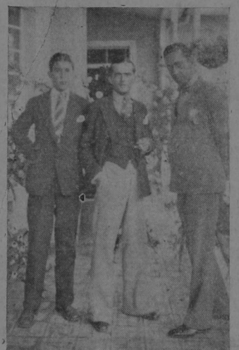
UNA CONVERSACION CON ELLOS EN LAS OFICINAS DE "LA TRIBUNA"